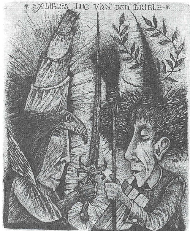
Sergej Chrapov/nominatie (boven)